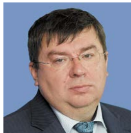
И. Н. Репин

«Безусловными приоритетами являются гарантия равного отношения ко всем акционерам и обеспечение реализации их прав на управление Банком, получение дивидендов и информации о деятельности Банка. Для этого Банк выстроил эффективную систему корпоративного управления и внутреннего контроля. При Наблюдательном совете Банка функционирует Комитет по аудиту, который совместно с Департаментом внутреннего аудита помогает органам управления обеспечивать эффективную работу Банка. Ревизионная комиссия осуществляет контроль за финансово-хозяйственной деятельностью Банка. Хотелось бы также выделить работу Консультационного совета акционеров (КСА) Банка в отчетном году: члены КСА принимали активное участие в коммуникациях с акционерами Банка, а также выступали в качестве спикеров на всех ключевых мероприятиях для акционеров, включая Дни инвестора в Москве и Санкт-Петербурге. Ежегодно Банк ставит новые цели по совершенствованию системы корпоративного управления и планомерно работает над их исполнением».